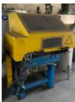
Referencia: MIC-059A CORTADOR ROTATIVO FLOCK Año: 2005 Marca: H&H Ancho mesa: 432