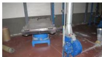
Referencia: MIC-060C TAMIZADOR Año: 2005 Marca: FUCHS Ancho mesa: .