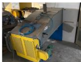
Referencia: MIC-061B TAMIZADOR Año: 2005 Marca: WERKHUIZEN SCHEPENS Ancho mesa: .