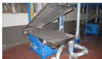
Referencia: MIC-059B TAMIZADOR Año: 2005 Marca: FUCHS Ancho mesa: .