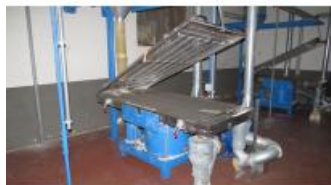
Referencia: MIC-059C TAMIZADOR Año: 2005 Marca: FUCHS Ancho mesa: .