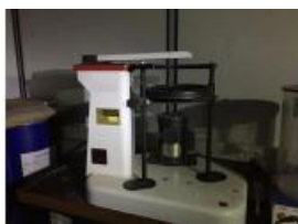
Referencia: MIC-2650 TAMIZADOR DE LABORATORIO Año: . Marca: W. S. TYLER Ancho mesa: .