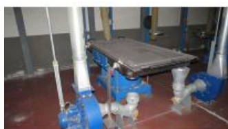
Referencia: MIC-060D TAMIZADOR Año: 2005 Marca: FUCHS Ancho mesa: .