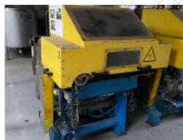
Referencia: MIC-060A CORTADOR ROTATIVO FLOCK Año: 2005 Marca: H&H Ancho mesa: 432