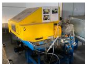
Referencia: MIC-061A CORTADOR ROTATIVO FLOCK Año: 2005 Marca: H&H Ancho mesa: 432