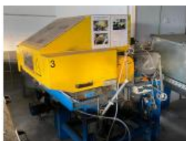
Referencia: MIC-061A CORTADOR ROTATIVO FLOCK Año: 2005 Marca: H&H Ancho mesa: 432