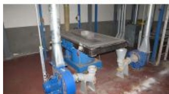
Referencia: MIC-060B TAMIZADOR Año: 2005 Marca: FUCHS Ancho mesa: .