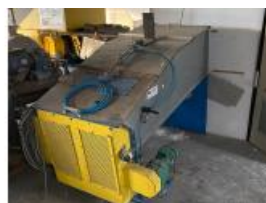
Referencia: MIC-061B TAMIZADOR Año: 2005 Marca: WERKHUIZEN SCHEPENS Ancho mesa: .