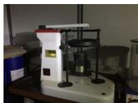
Referencia: MIC-2650 TAMIZADOR DE LABORATORIO Año: . Marca: W. S. TYLER Ancho mesa: .