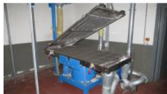
Referencia: MIC-059D TAMIZADOR Año: 2005 Marca: FUCHS Ancho mesa: .